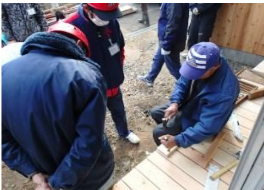
道具の使い方を習う

共通しているのは、将来田舎で古い民家に住み、自分で修理しながら住みたいということです。参加された方は、講師の方から仕事の基本を習いながら、熱心にリフォームに取り組んでいます。