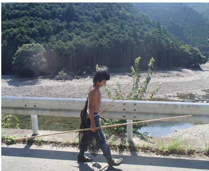
【宮川と生きる生粋の大杉っこ】

他所から移住してきた私からすると、今の宮川でも十分にきれいだなぁと感動するわけですが、地域の方からかつてのホタルが乱舞し、魚やウナギ、様々な生き物が住まう宮川の美しさ、川の恵みと共に穏やかに続いてきた古き良き暮らしを想像し、地域の皆さんの心の奥にある懐かしい大杉谷の原風景に思いを馳せてみます。