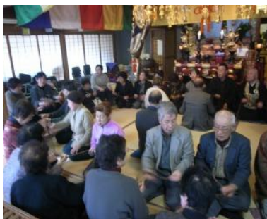
【西光寺の念仏はじめ】

1・2月はお寺や神社の行事にいろいろと参加させて頂きました。念仏はじめの数珠繰りや、津島神社での餅まき等、初めて見る珍しい光景に感慨深いものがありました。