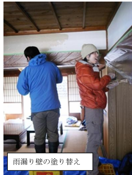
雨漏り壁の塗り替え

参加者には大杉谷を気に入って連続して来る方も出てきました。この場所を好きになる方がいるという事をありがたく感じ、いつか移住が実現できるよう、受け入れ側の体制をしっかりと作り上げていきたいと思えます。