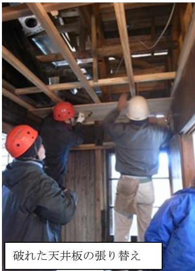
破れた天井板の張り替え