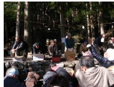
【白熱した餅まきの様子】