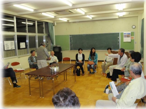
熱心に議論する参加者のみなさん

6月5日地域総合センターにおいて、Iターンの定住を成功させた岐阜県の奥矢作移住定住促進協議会と座談会を行いました。