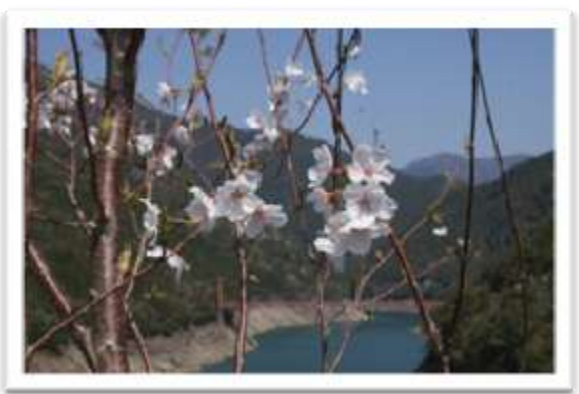
○平成23年2月に植樹した通称『軍艦島』の桜。