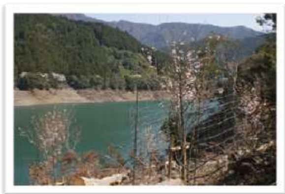
○平成24年2月にふるさと交流会植樹会で植樹した東屋下の桜。