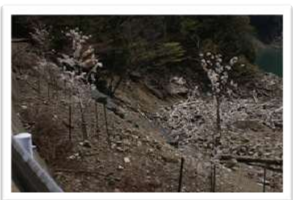
○平成23年2月植樹した鹿野掛橋近くの桜。